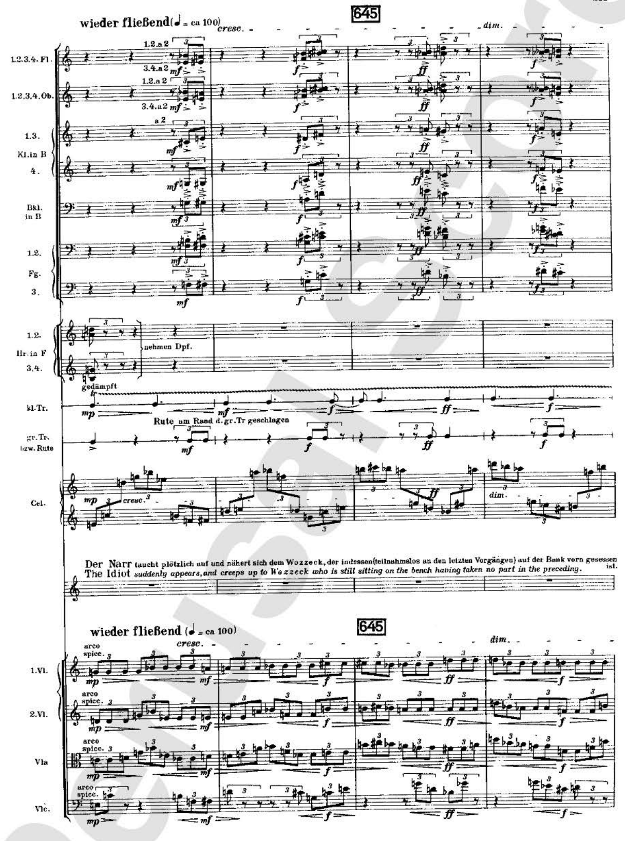
U.E. 7379 / U.E. 12100