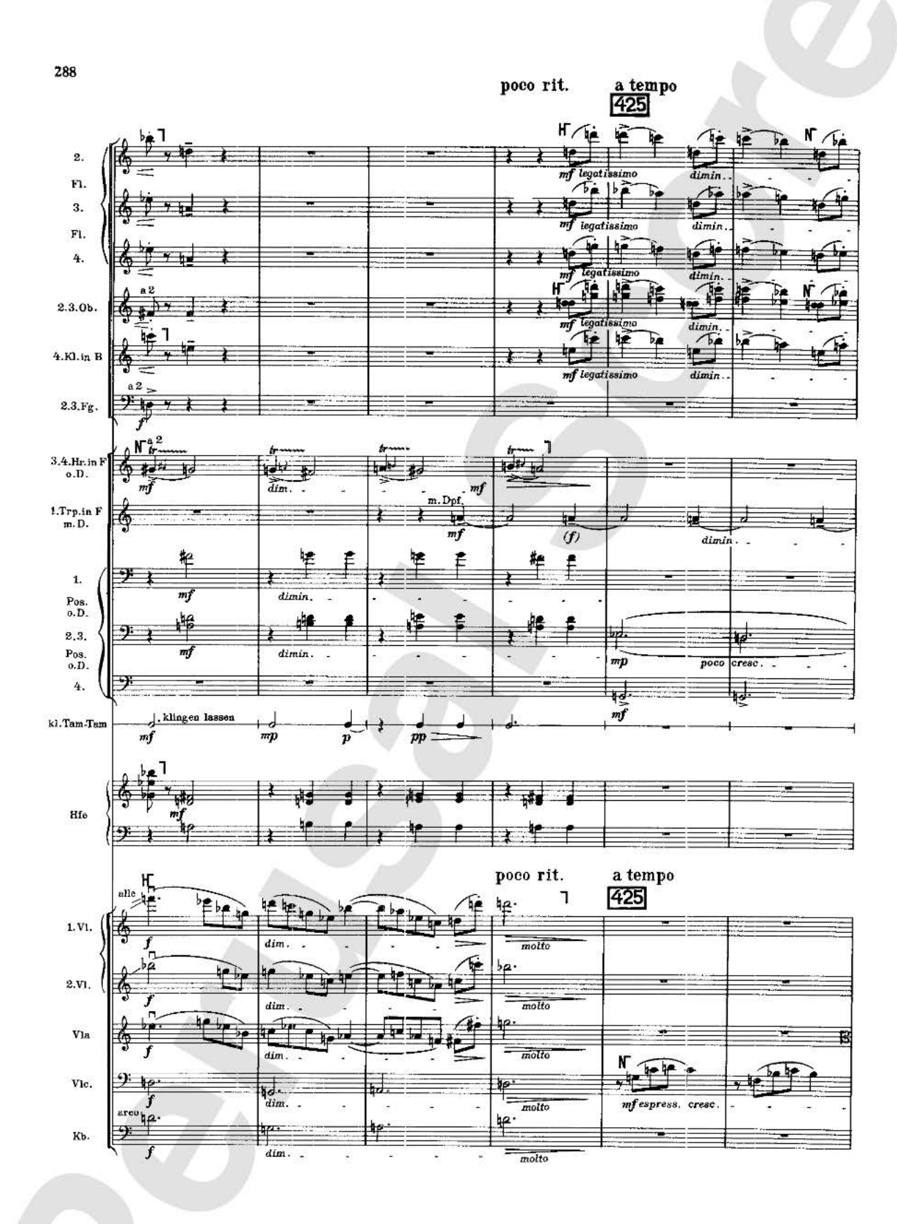
U.E. 7379 / U.E. 12100