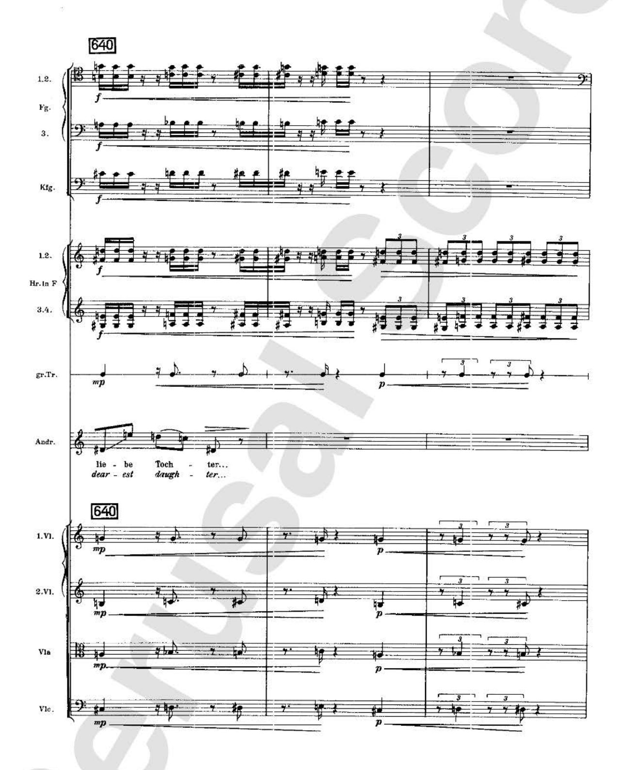
U. E. 7379 / U.E. 12100