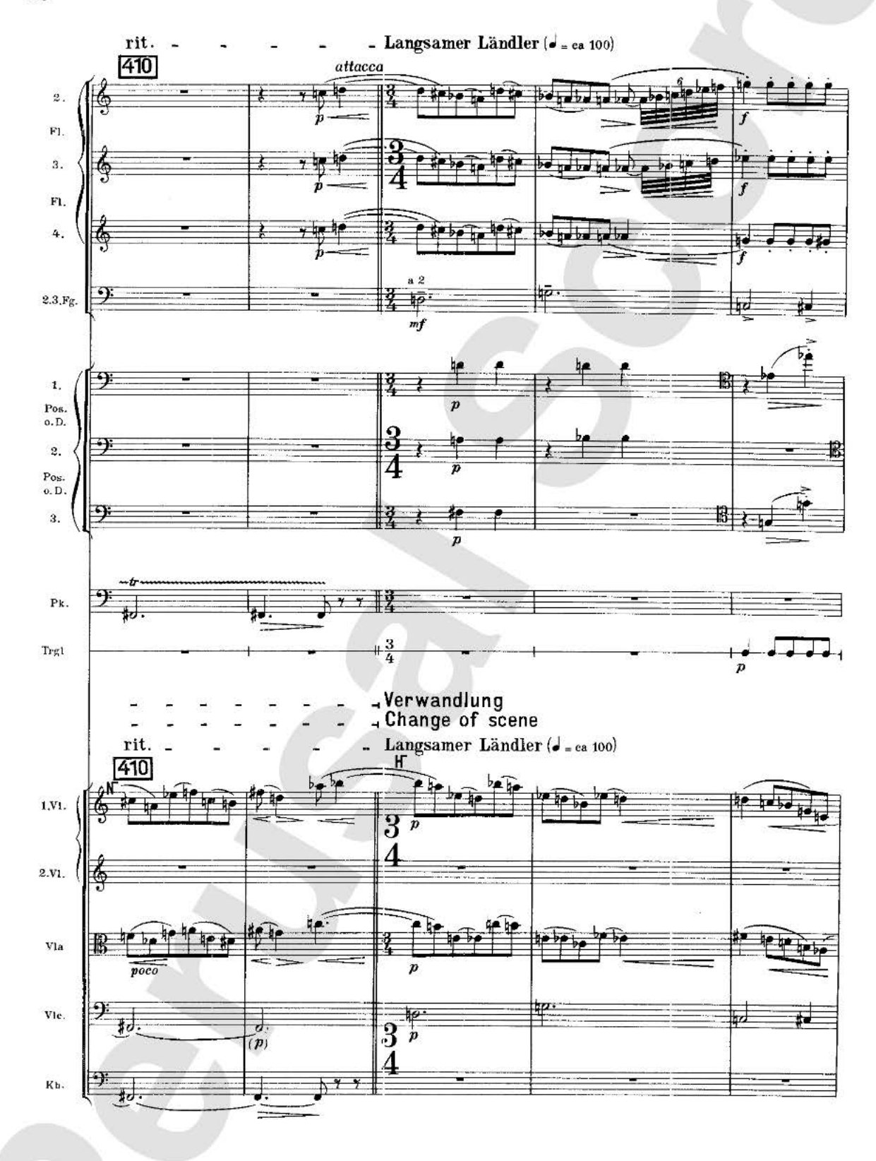
U.E. 7379 / U.E. 12100